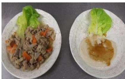
写真 (左: 常食)