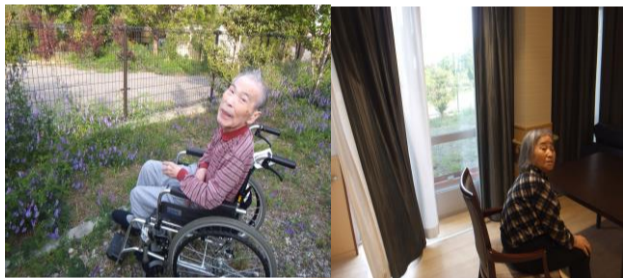
好天と薫風に誘われ施設内の自然と親しんだり換気中にそよぐ爽やかなそよ風を感じたりと…