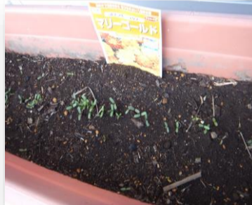
春先に皆さんで蒔いた種から芽が🌱