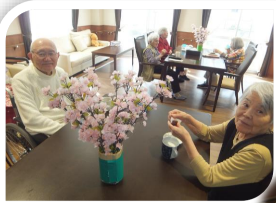
桜で春を感じます🌸