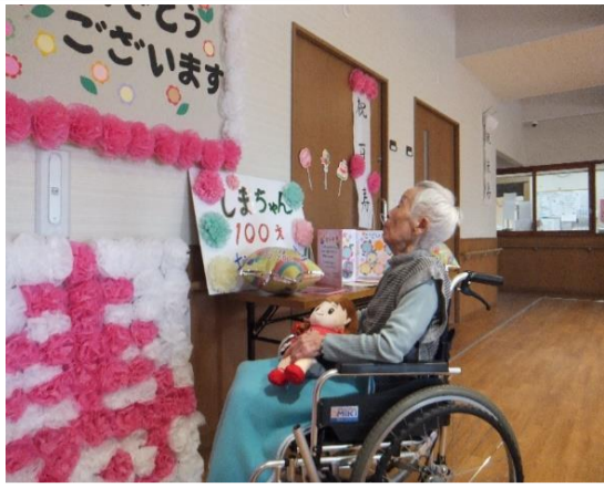
🎂百寿おめでとうございます🎂