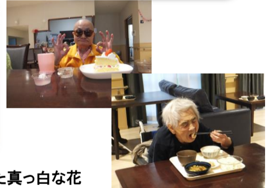
〜毎日の楽しみ〜 フルーツ仕立てのおやつと 季節の食材に彩られた食事。

※特別養護老人ホーム毛里田(morita_tokuyou)- Instagram では施設での行事、食事メニューの内容等、画像でご覧いただけます。