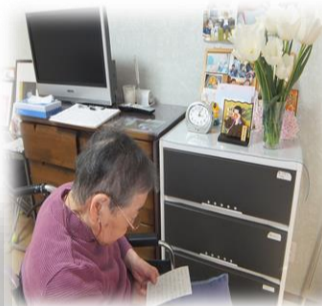
ご家族から届けられた真っ白な花 お便りには何度も目を通され ています。