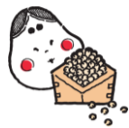
職員手作りのゲームを楽しんで頂きました