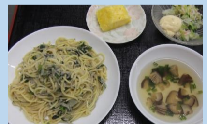
菜の花としらすの和風パスタ